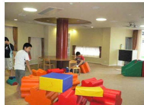
好評なキッズルーム例(2)