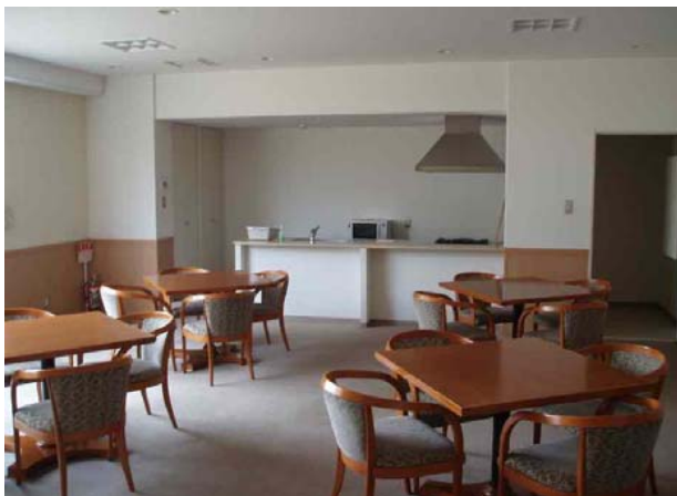
好評なパーティールーム例(1)

【利用時間】 通常、現地スタッフの勤務時間にあわせるが、11:00～17:00くらいまでの利用が多いので朝からの利用でなくても問題なし。