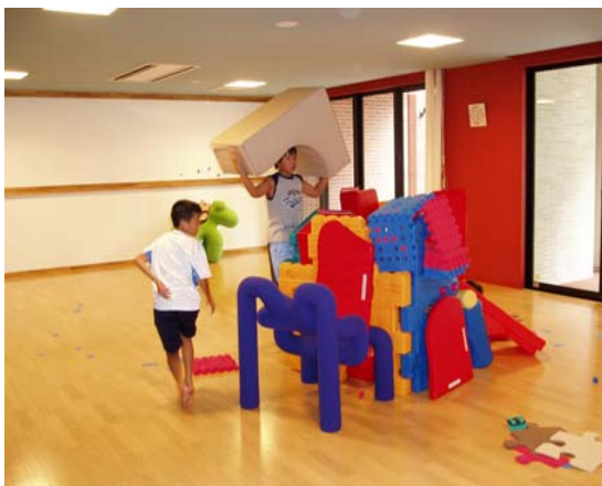
好評なキッズルーム例(1)

他の共用施設より利用時間を短くしている物件が多く夕方以降はシアタールーム等と兼用し利用するなどのケースもある。