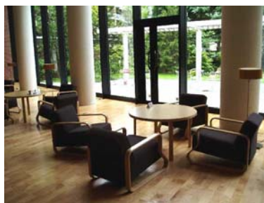
中庭が眺められる明るい空間