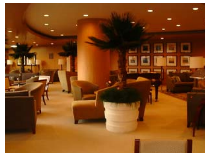
高級感ある落ち着いた雰囲気