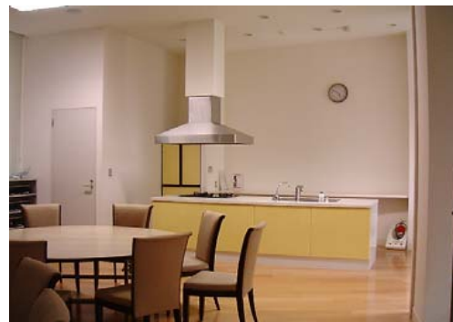
好評なパーティールーム例(2)