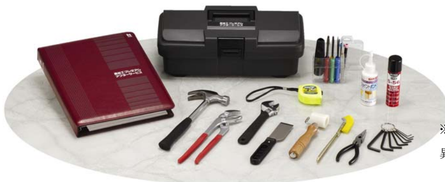
[図-3] 「住まいの整備手帳」と「メンテナンスキット」(イメージ)