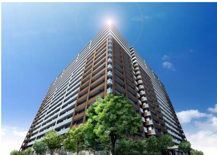
『ヴィーナススクエア』参考パース