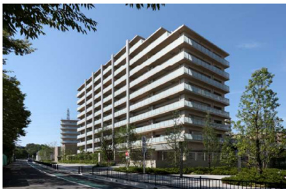
街角広場と東側遊歩道