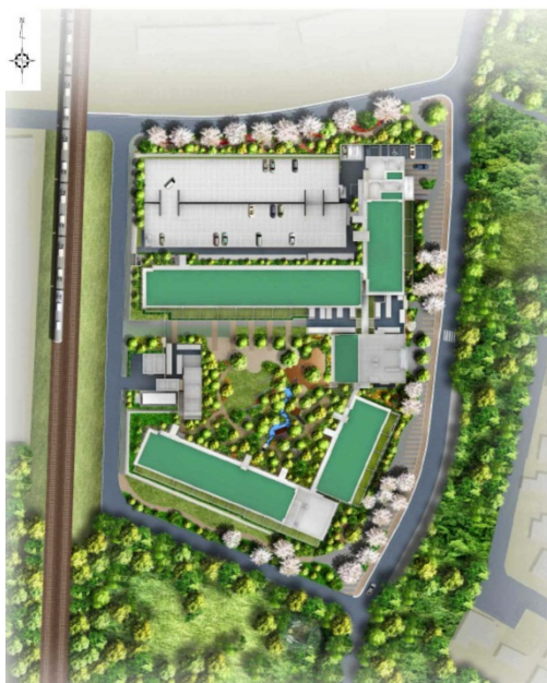
敷地全体図(撮影位置図)