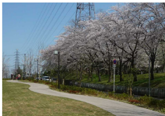
千里緑地に面した遊歩道