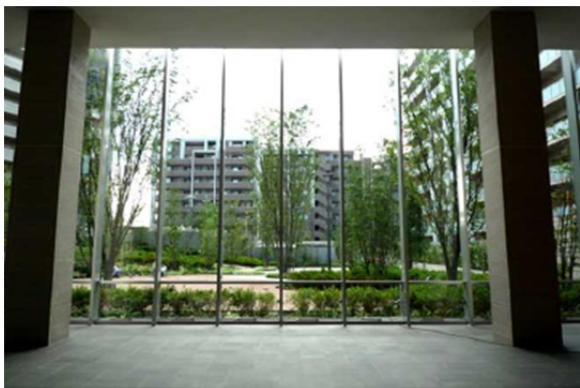
ロビーから中庭を望む