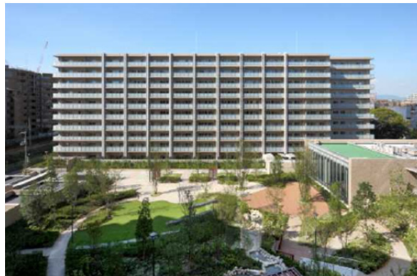
中庭全景(南側からの見下ろし)