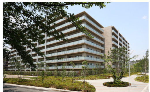
東南側建物外観図

本物件は阪急千里線「南千里」駅より徒歩6分にあり、開発面積は18,000㎡超で、吹田市の「千里ニュータウンまちづくり指針」に基づいて、敷地全体を庭園化し、空地を生かした配棟計画としています。敷地中央部には約2,750㎡の中庭広場を、建物の外周部には敷地を四方に囲む幅員1.8m以上の遊歩道(ソメイヨシノ等の保存樹を生かした桜並木等)、街との親和性に配慮した敷地配置となっています。