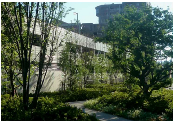
北側遊歩道のヤマト(既存樹を移植し保存)