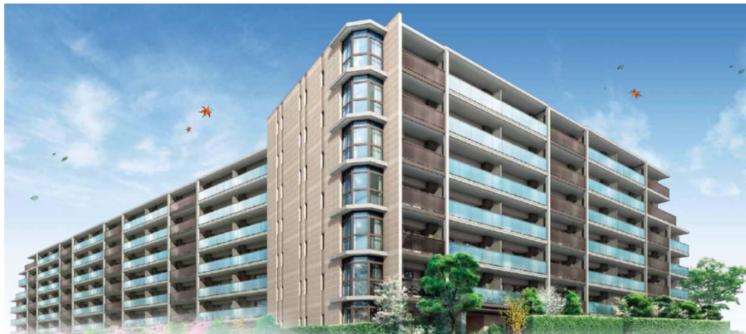
【「ブランシエラ浦和駒場」の外観予想パース】

（長谷工プレミアムアフターサービス、長谷工コミュニティの情報システム“素敵ネット”）