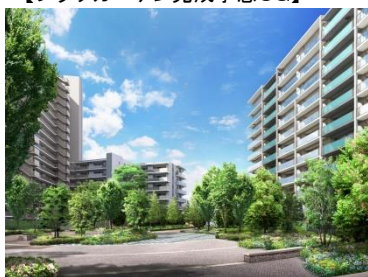
【プラザガーデン完成予想CG】