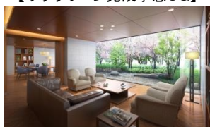
【サクラサロン完成予想CG】