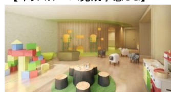
【キッズルーム完成予想CG】