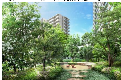
【シーズنزガーデン完成予想CG】