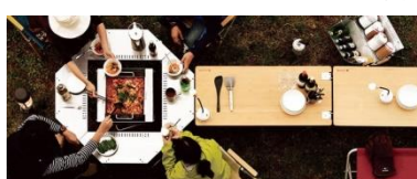
火を囲める”ジカローテーブル”参考写真