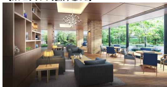
【カフェラウンジ完成予想CG】