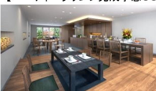
【パーティーラウンジ完成予想CG】