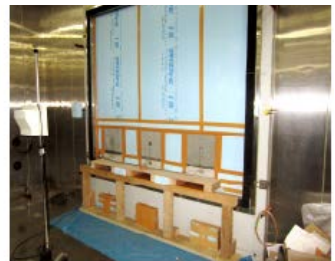
防露性能試験状況