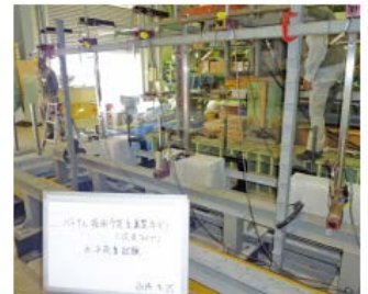
手摺の水平荷重試験