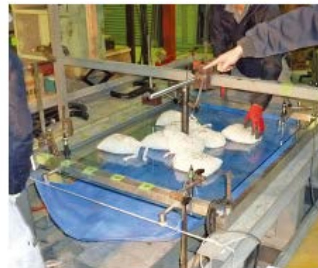
手摺ガラス水平等分布荷重試験状況

長谷工技術研究所にて、手摺強度試験（水平荷重、耐風圧性）を実施。日本の手摺強度基準レベルの性能を確認した金属手摺を採用。