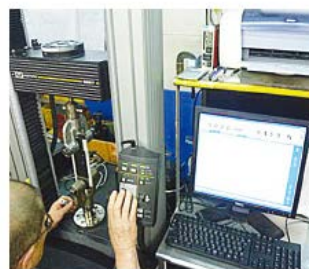
防水材の性能確認試験

長谷工技術研究所にて、水密性試験を実施。外壁に面するサッシ周りなど室内に雨水が浸入しやすい個所を中心に、日本と同等性能を有する防水材にて防水工事を施工。