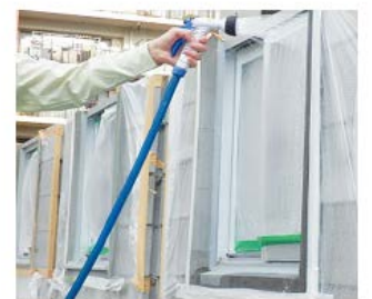
サッシ廻り防水性能試験