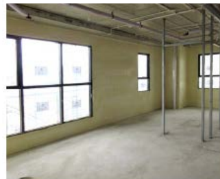
断熱材吹付施工状況

長谷工技術研究所にて、ハノイの気象条件を想定した防露性能試験を実施。結露によるカビの発生を抑えるため、外気に面する壁に断熱材を吹付け。