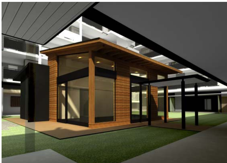
【「パーティールーム」の完成予想パース】