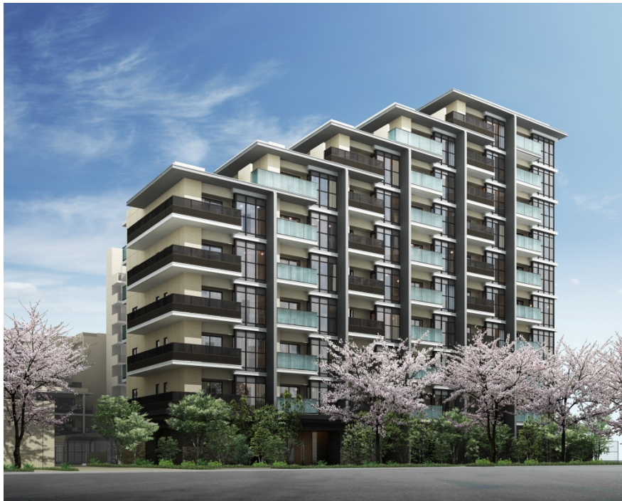
〔賃貸・有老複合施設の外観予想パース〕

(※1)「北区王子５丁目プロジェクト」は、分譲マンション（「ザ・ガーデンズ東京王子」）・賃貸マンション・介護付有料老人ホーム・商業施設・保育施設からなる複合開発