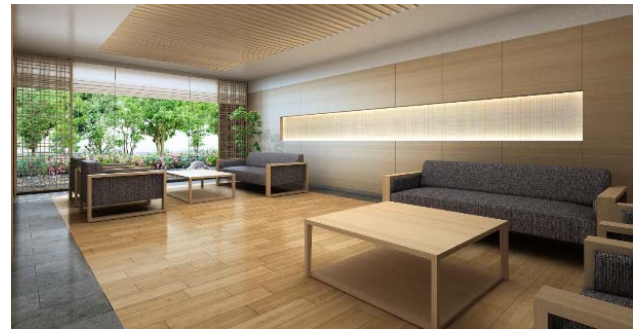
【「ラウンジ」の完成予想パース】