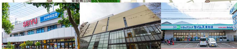
※○谷中公園：徒歩3分 ○西友徒歩3分 ○北綾瀬聖華保育園：徒歩3分