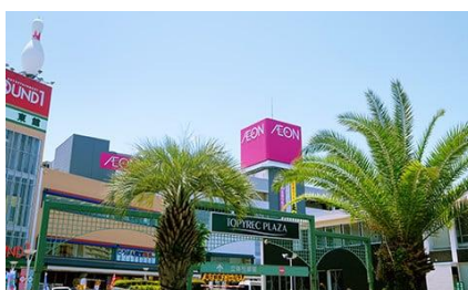
トビレックプラザ(同 10 分)