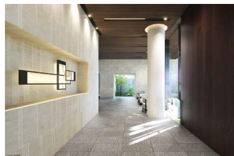
(左)外観・(上)ロビー (下)プライベートガーデン