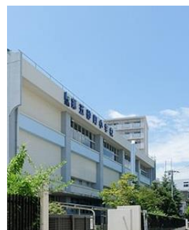
第五砂町小学校 (同 2 分)