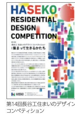
第14回長谷工住まいのデザインコンペティション

今後も開催を継続し、住まいへの関心を高めていただくとともに、才能ある学生の人材育成につなげていきます。