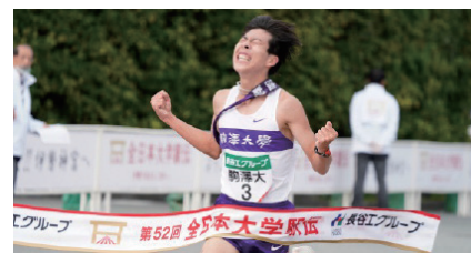
第52回全日本大学駅伝の様子