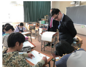
地域小学校への出張授業

細田工務店では、快適で豊かな地域・社会の実現とその持続的な発展を目指し、良き企業市民として、芸術文化支援を通じた交流活動や、暮らしをサポートするセミナーやイベントなどを開催し協働することで、本社を構える杉並区阿佐ヶ谷周辺の地域社会への積極的な参加と共生活動を推進しています。