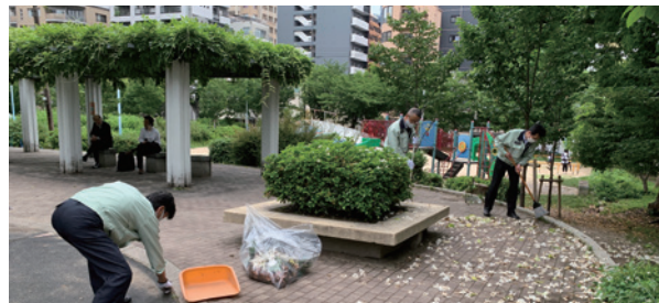
中大江公園清掃活動の様子

長谷工テクノでは、2017年より機材センター周辺歩道及び近隣の淀川河川堤防などの清掃活動を協力会社と共に実施しています。