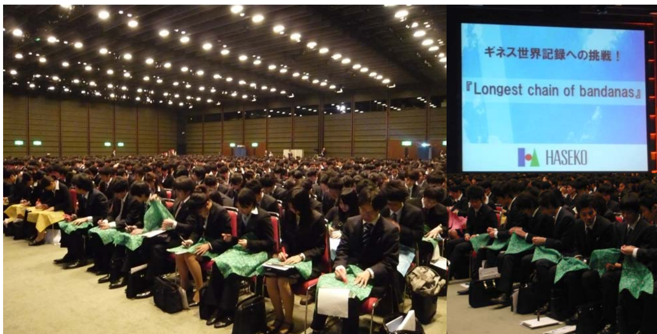
[左：バンダナに決意表明を記入する様子、右下：バンダナを隣の人と結び始める様子]