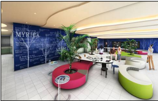
インターナショナルカフェ