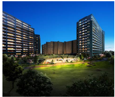
ウェルカム!プラザ