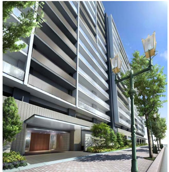
【「ステーションテラス若葉」外観予想CG】