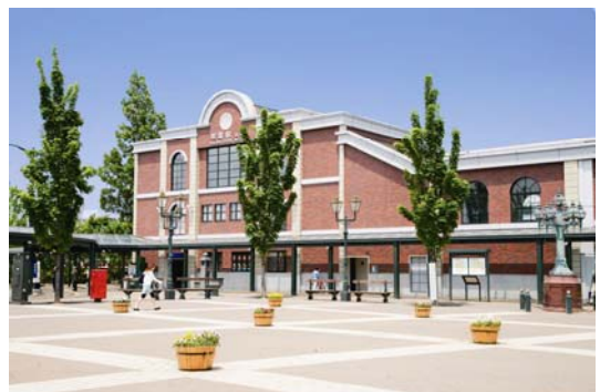
[若葉駅 西口駅前広場]

平成16年にアンティークな駅舎が完成。美しく整備された西口駅前広場、ロータリーに加え、駅西口舎内には、保育ステーションがあり、子育てファミリーにも優しい生活環境を実現。