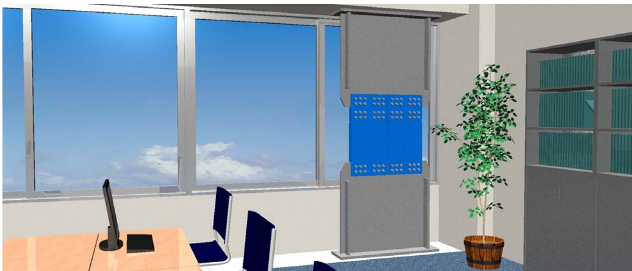
〔事務所ビル（制振部は内装で囲むことも可能）〕