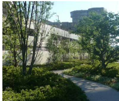
敷地北側の遊歩道