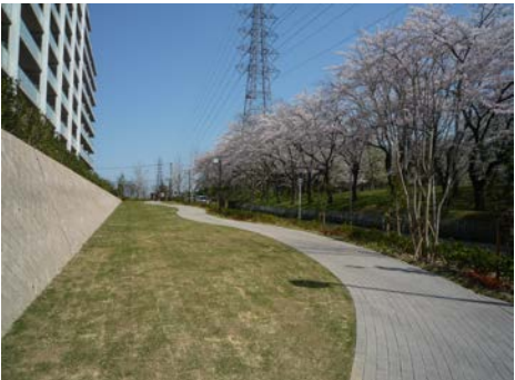
千里緑地のサクラ