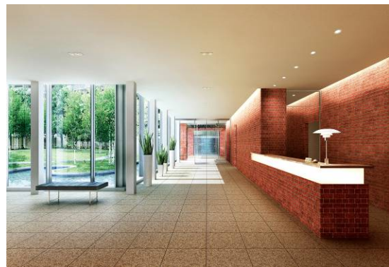
エントランスホール完成予想 CG