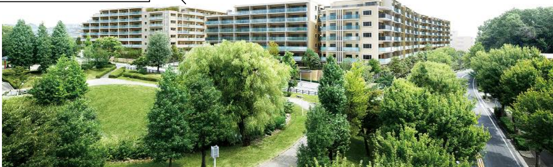
西面外観完成予想図