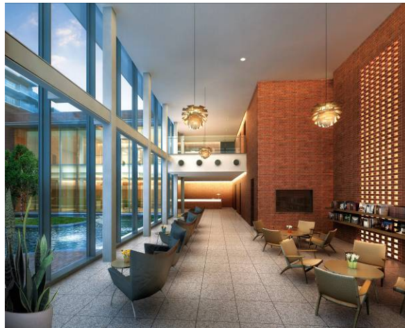
ライブラリーラウンジ 完成予想 CG