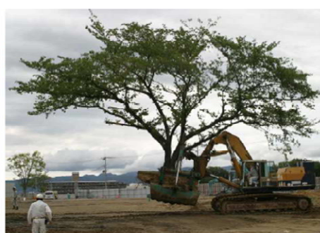
重機を使ったサクラの移植状況