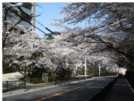
保存した桜並木 (左側が計画地・右側が保存緑地)