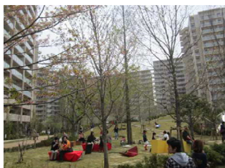
多くの人々が思い思いの時間を 過ごせる芝生広場