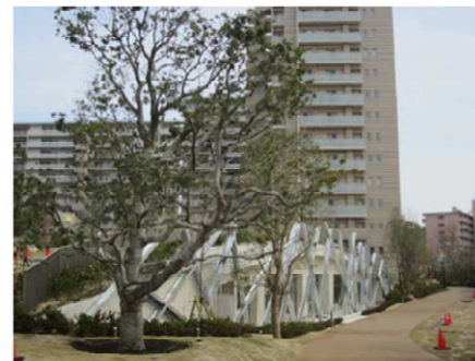
地上レベルと繋がる屋上の芝生広場を計画 した共用棟、手前は移植したヤマモモ