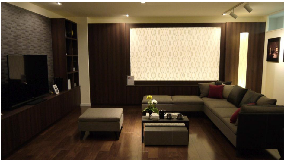
【「リフォーム工房 武蔵野」の接客サロン】