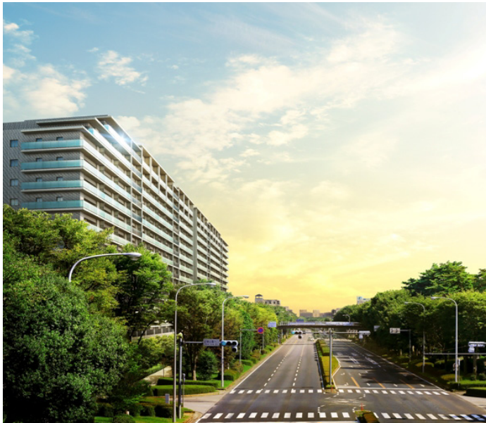
完成予想図(建物外観)

1975年生まれ。2003年京都大学工学部卒業と同時に「ロボ・ガレージ」を創業し京大 内入居ベンチャー第一号となる。代表作に「週刊ロビ」「ロビッド」「FT」など。2013年、世界 で初めてコミュニケーションロボット「キロボ」を宇宙に送り込む事に成功。ロボカップ世界 大会5年連続優勝。米 TIME 誌「2004年の発明」、ポピュラーサイエンス誌「未来を変える 33人」に選定。「エボルタ」によるグランドキャニオン登頂、ルマン24時間走行等に成功し ギネス世界記録認定。(株)ロボ・ガレージ代表取締役、東京大学先端研特任准教授、大 阪電気通信大学客員教授、ヒューマンアカデミーロボット教室顧問。