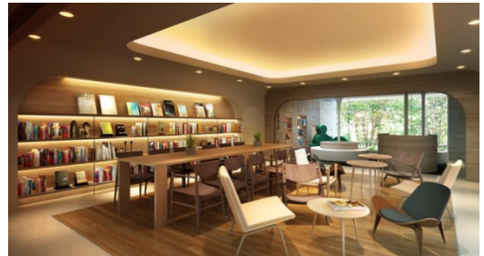
完成予想図(ライブラリーラウンジ)