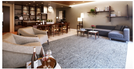
完成予想図(パーティールーム)