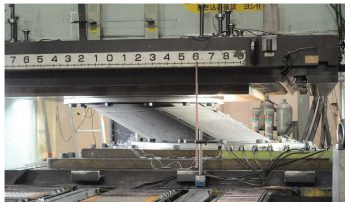
写真-1 免震部材(鉛プラグ挿入型積層ゴム)の傾斜実験状況写真例