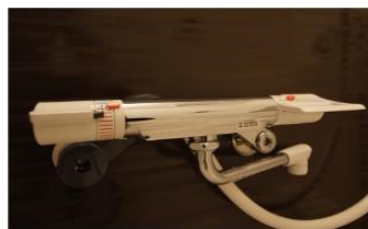
サーモスタット混合水栓