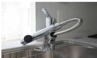
ハンドシャワー水栓