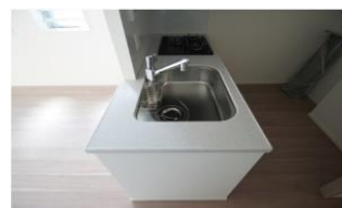
カウンターキッチン