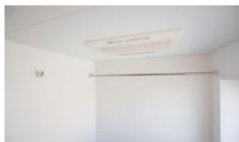
浴室換気暖房乾燥機