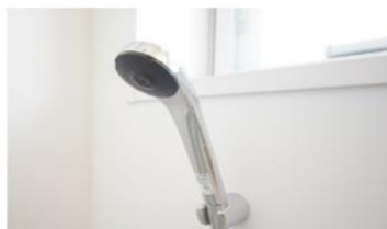
メタルシャワーヘッド