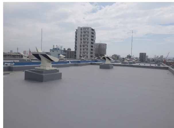
〔左：防水改修前、右：防水改修後〕