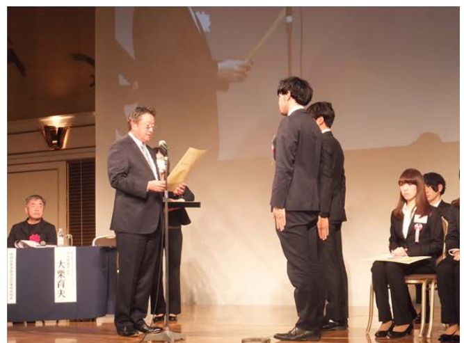
[表彰式の様子 (2018年1月14日・於 東京プリンスホテル) ]