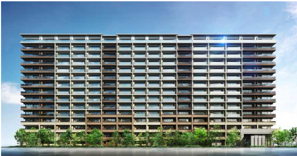
完成予想 CG パース