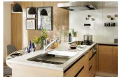
③子供の成長に合わせて空間を