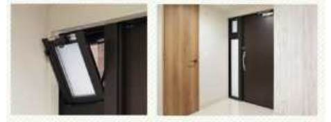
②家族とコミュニケーションが取れる