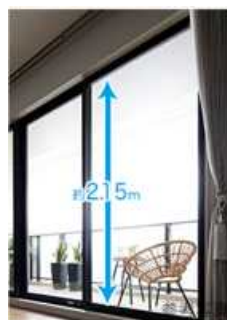
⑤両面アウトフレームが