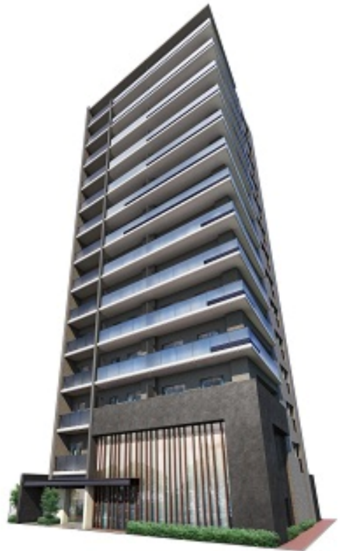
[左：エントランス完成予想図 / 右：外観完成予想図]