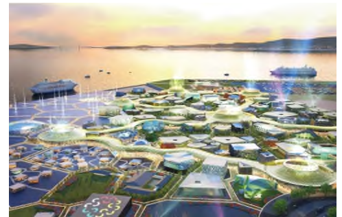
【大阪・関西万博 イメージ】