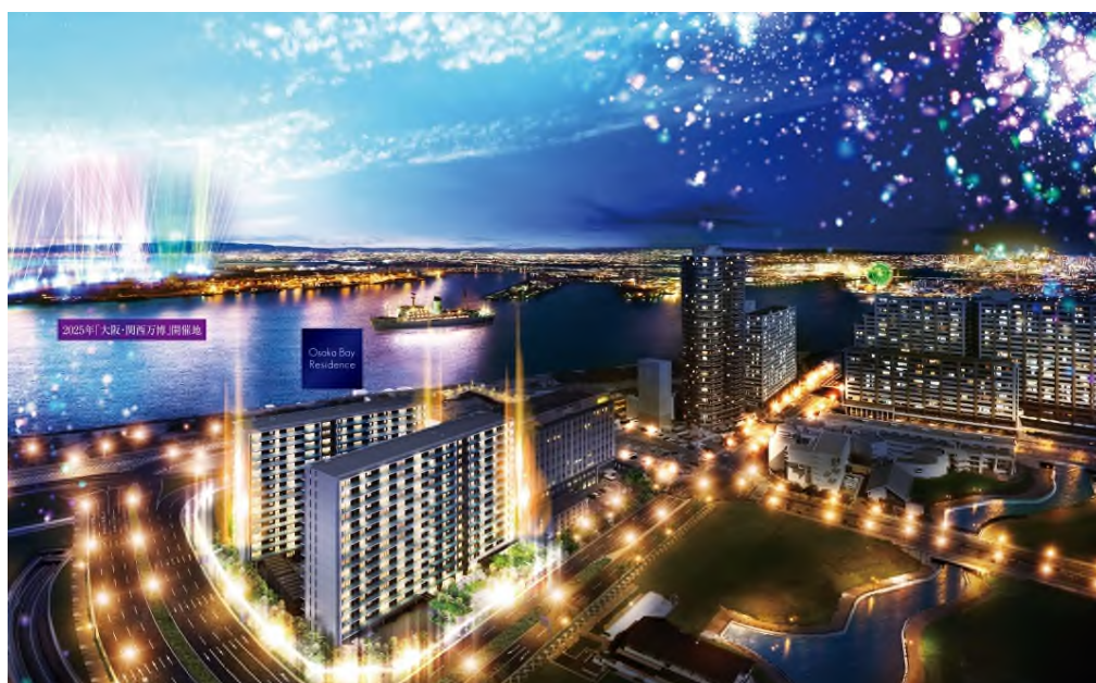
【大阪ベイレジデンス 外観完成予想CG】

※2 2011年以降咲洲エリアでの新築分譲マンションは約8年ぶり。（2019年MRC調べ）