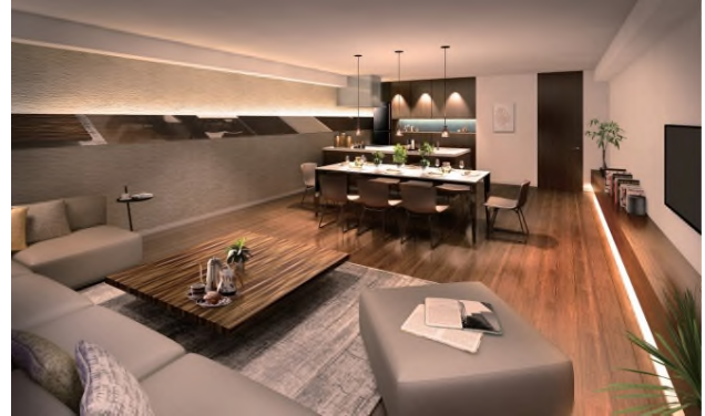
【パーティールーム イメージ】