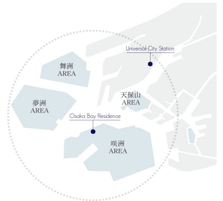
【大阪ベイエリア 概念図】

また、2025年の「大阪・関西万博」の夢洲での開催決定や、「IR誘致計画」に伴い、今後の「大阪ベイエリア」の更なる発展が見込まれます。