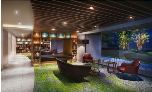
【ブックラウンジ イメージ】

海遊館および、ハイアットリージェンシー大阪がマンションと連携し、このようなサービスを行うのは初めての試みです。