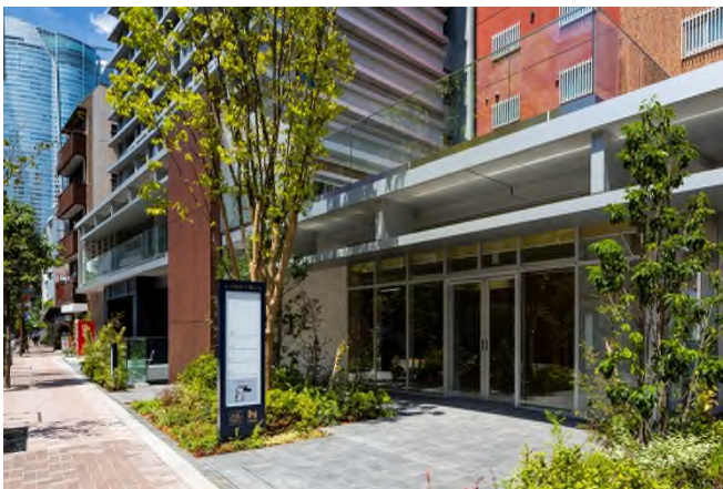
[ 「ルネ麻布十番ビル」の1階、2階テラス写真 ]

総合地所は、今後も開発を手掛けるエリアにおいて新たな賑わいの創出に寄与するとともに、エリアの魅力向上に貢献してまいります。