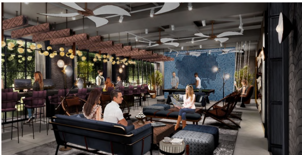
[ 「THE LIVELY 麻布十番」ラウンジ イメージパース ]