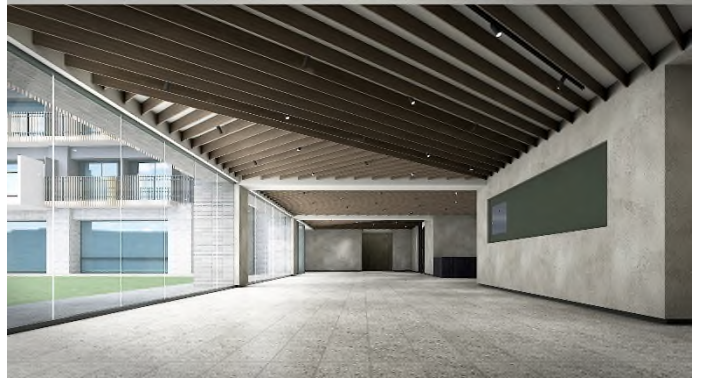
〔エントランスラウンジ〕