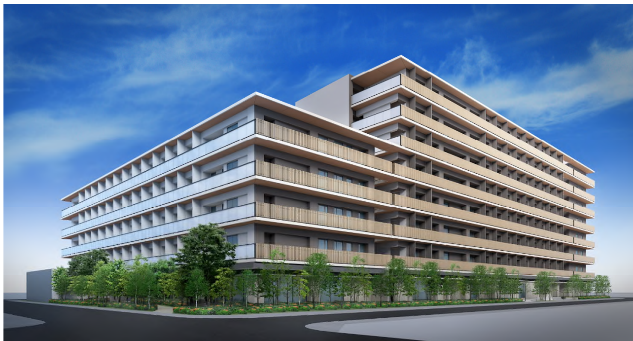
[「コムレジ赤羽」北西側外観(完成予想図)]

[開発コンセプト] 若いチカラと大人力の交流で育む、“成長×成熟”化学反応型コミュニティ