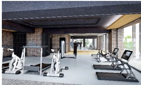
〔フィットネススタジオ〕