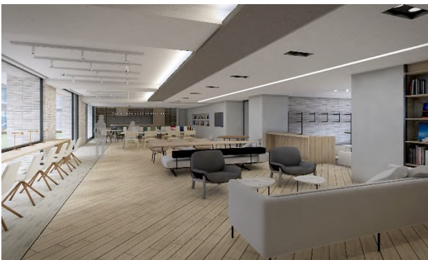
〔コミュニティラウンジ〕