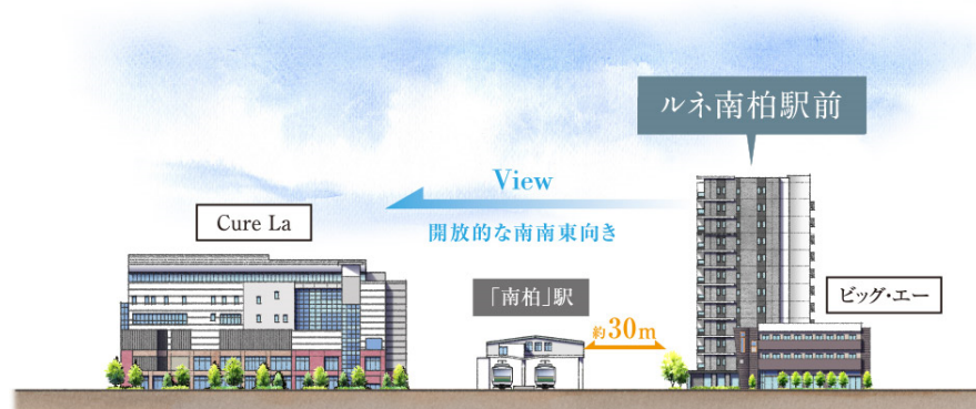
南南東向き概念イラスト