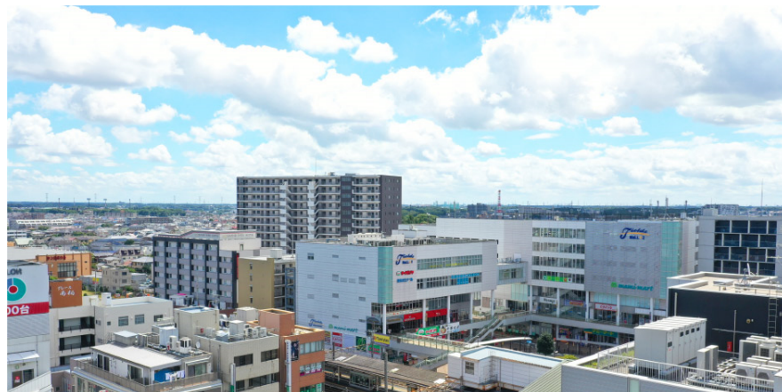
Eタイプ10階相当より南柏駅を望む