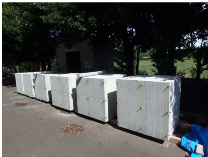
[ 開発実験で作製した模擬部材試験体の様子 ]