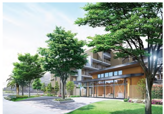
ルームパーク 完成予想図

「ルネ西宮甲子園」は新しい街のシンボルロードであるけやき並木の遊歩道「ブルバール」沿いに誕生。四季折々に敷地を彩る 65 種類もの植栽計画など、爽やかな並木道と一体感あるランドプランを計画しました。