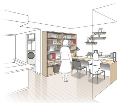
ファミリーアトリエ イラストイメージ図

リビングダイニングの一角に「ファミリーアトリエ」を設けたプラン。テレワークはもちろんお子様の宿題スペースにも役立ちます。