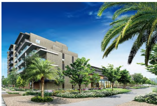
建物外観 完成予想図