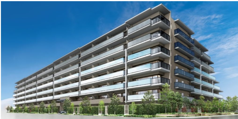
建物外観 完成予想図

「ルネ西宮甲子園」は新しい街づくりが行われている浜甲子園エリアに位置し、自然豊かな環境と生活利便性、テレワークに対応した間取りなど多彩なプランが評価され、第 1 期販売では 59 戸を供給し、50 戸の契約をいただきました。