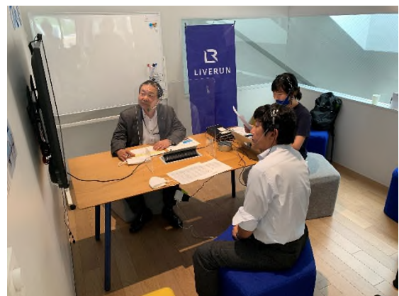
【LIVE RUN 実況中継の様子】