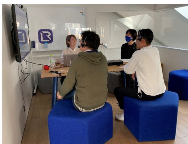
【LIVE RUN 実況中継の様子】