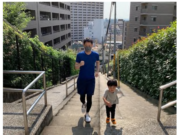
【LIVE RUN 当日参加者の様子】