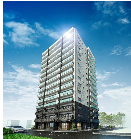
ブランシェラ札幌東区役所前

https://www.branchera.com/ms/sapporo-maruyama