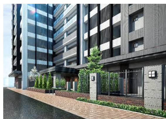
ブランシエラ札幌桑園 建物外観 完成予想図

※掲載の完成予想図は計画段階の図面を基に描き起こしたもので、実際とは異なる場合があります。