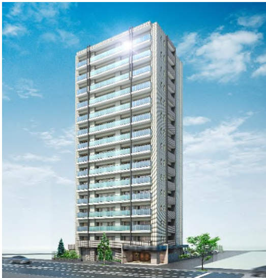
ブランシェラ札幌円山

当社では、「ブランシェラ札幌桑園」に続き、第二弾として「ブランシェラ札幌円山」、第三弾として「ブランシェラ札幌東区役所前」の販売を予定しております。モデルルーム公開時期は2022年初夏頃を予定しています。