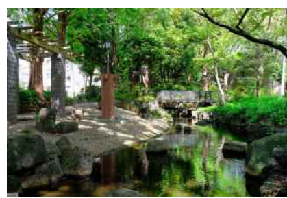
【小松川境川親水公園】