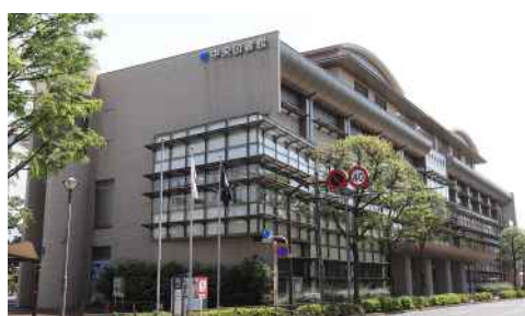
【江戸川区立中央図書館】