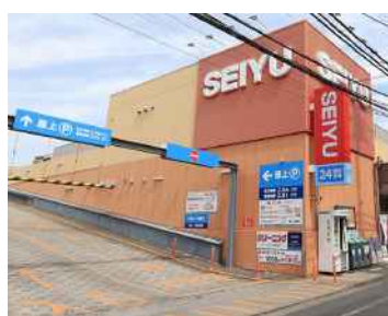
【西友江戸川中央店】