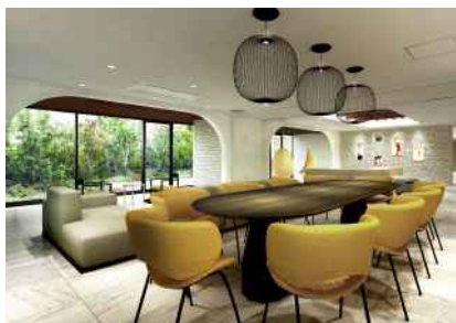
【コミュニティラウンジ】