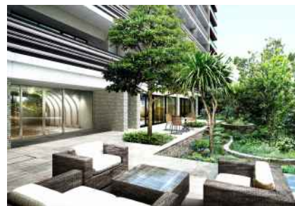
【サンパティオ（中庭）】