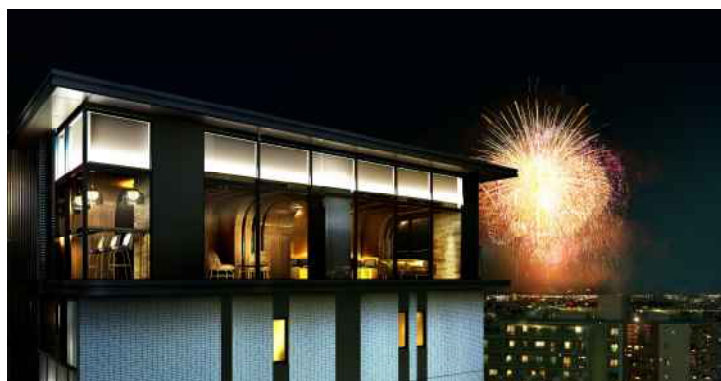
【「プレミスト新小岩ルネ」イメージ】

今回販売する「プレミスト新小岩ルネ」は、東京都江戸川区で豊かに暮らすことを目指した「TOKYO EDENCE ※1 PROJECT」をコンセプトとし、徒歩 5 分圏内に商業施設や医療施設、教育・子育て支援施設、公園などの生活利便施設が充実した子育てにも適した分譲マンションです。