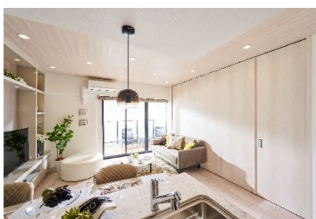
ウォールドアクローズ時