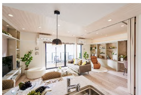
ウォールドアオープン時