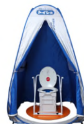
非常用マンホールトイレ