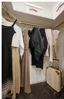
ウォークインクローゼット