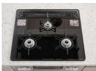
ガラストップ 3口ガスコンロ