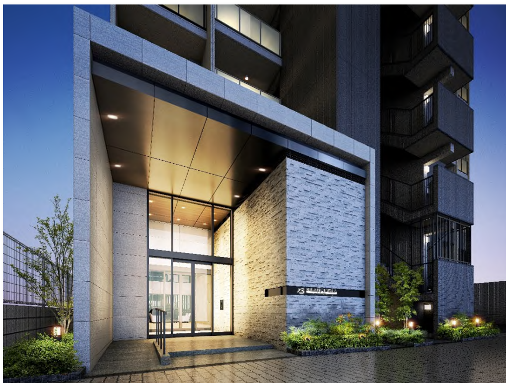
ブランシエラ ディライト照国 エントランス 完成予想図

「ブランシエラ ディライト照国」は、古くから鹿児島島の中心を担い続けてきた天文館アーケードまで歩いて6分。都心の高い利便性、歴史・文化が薫る住宅地の落ち着き、城山の色濃い自然の潤いが調和するロケーションに誕生します。自分らしいライフスタイルを叶える場所として、1LDK から3LDK まで揃えた全4タイプのプランバリエーションなど、私たち「長谷工不動産」の考えるいい住まい、新しい都市居住の理想を追求した住まいのご提案となります。本物件を皮切りに、今後当社は「ブランシエラ」「ブランシエラ ディライト」シリーズを継続的に展開してまいります。