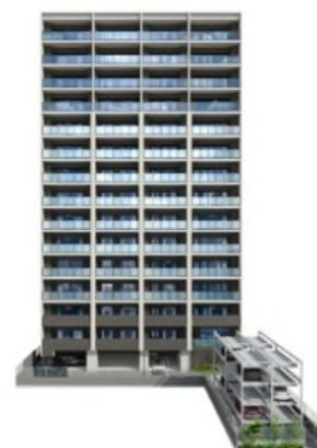
ブランシエラ ディライト照国 建物外観 完成予想図

※掲載の完成予想図は計画段階の図面を基に描き起こしたもので、実際とは異なる場合があります