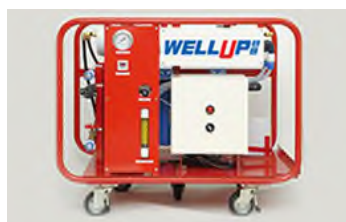
非常用飲料水生成システム 「WELL UP ミニ」