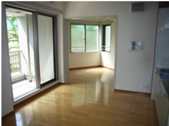
〈B タイプ〉 BEFORE：1DK タイプ