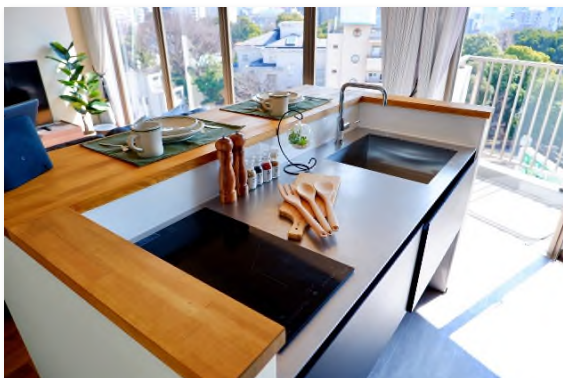
〈C タイプ〉 AFTER：キッチンカウンター