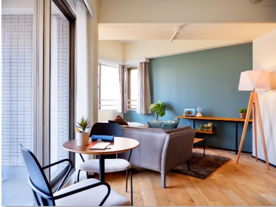
〈B タイプ〉 AFTER：モデルルーム