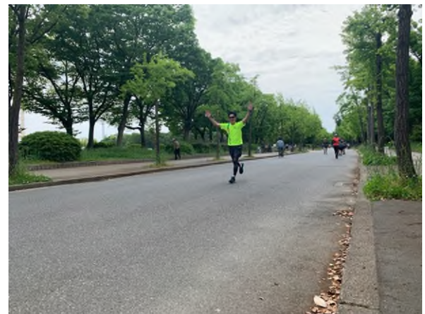
【LIVE RUN 当日参加者の様子】