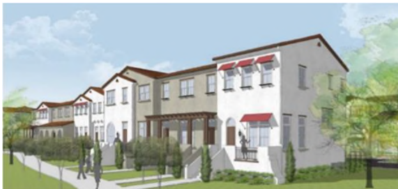
タウンハウスタイプ