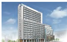
外観完成予想図