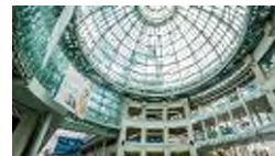
丸亀町商店街／徒歩 8 分（約 620m）