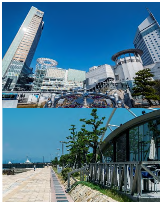
現地周辺写真（2021 年 8 月撮影）

香川県・高松市の玄関口である JR「高松」駅へ徒歩 3 分、さらに JR「岡山」駅へ直通 52 分、「高松空港」へバスで最短 42 分というアクセスが魅力です。JR「高松」駅周辺には、商業施設、オフィス複合型の四国最高層のビルである「高松シンボルタワー」をはじめとして、商業施設、ホテル等が集積し、ベイサイドの開放感に包まれた「サンポート高松」の近代的な都市風景が広がります。また、「高松三越」や「丸亀町商店街」をはじめ、「高松赤十字病院」「高松市役所」「高松市美術館」などの多彩な生活利便施設が徒歩圏となります。