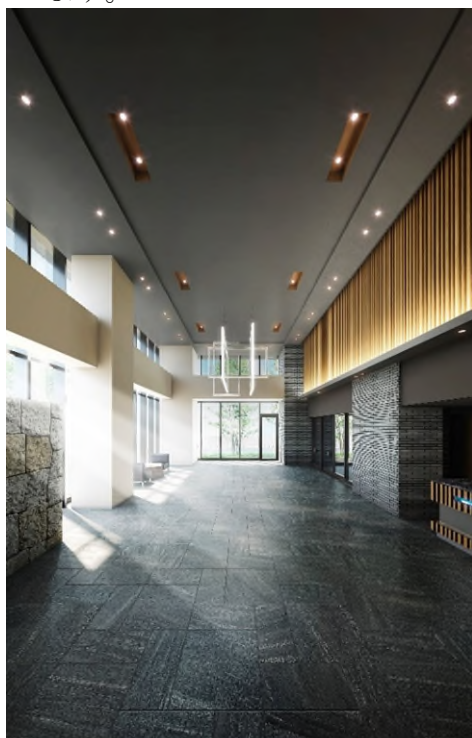
エントランスホール完成予想図

建物の入り口やエントランスホール内部まで続く壁面には、豊かな風情や重厚感を演出する「石垣」を配しました。また、ホールや「オーナーズラウンジ」には、旧高松城主の高松・松平家の別邸や、迎賓館として使われた「披雲閣(ひうんかく)」から着想を得たマテリアルやデザインを採用しています。共用部には、テレワーク等にも最適なコワーキングスペースも設けています。