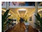
ミスパリ名古屋ビル