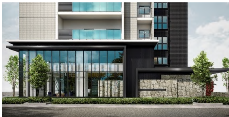
エントランスアプローチ完成予想図