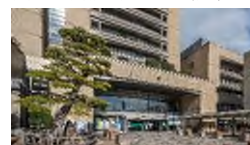
高松市役所／徒歩 13 分（約 990m）