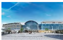
外観完成予想図

JR 四国は新たな「高松駅ビル」の建設計画を発表。スーパーやフードホールなど約 70 店をテナントとして誘致します。駅と直結する 4 階建ての商業棟（延べ約 9,200 m 2 ）など 2023 年度開業予定です。