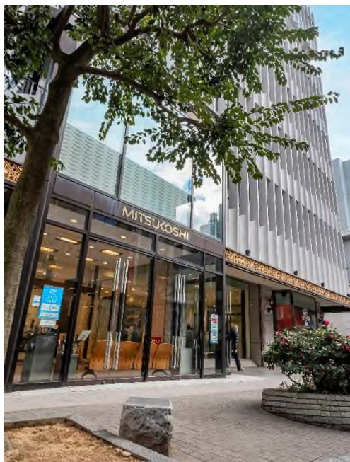
高松三越／徒歩 8 分（約 570m）