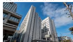
高松赤十字病院／徒歩 14 分（約 1,100m）