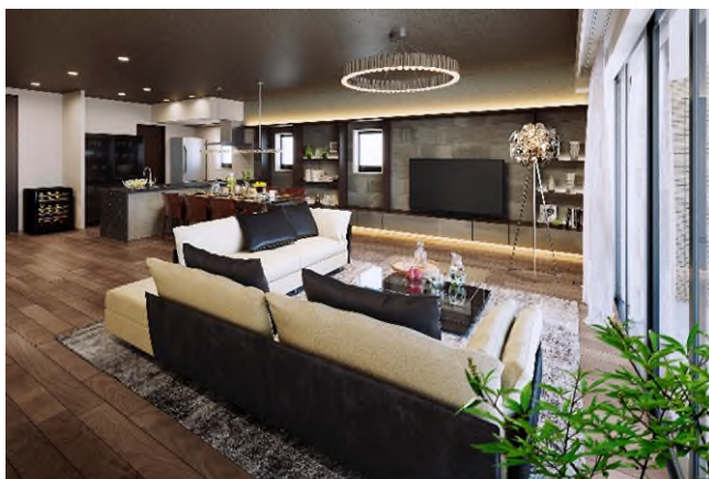
H タイプ室内イメージパース

住居専有面積 160.11m 2 (約48.43坪) ※防災備蓄倉庫6.37㎡含む