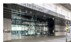
高松市美術館／徒歩 9 分（約 700m）