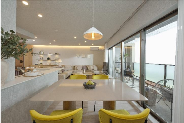
リビングダイニング①

モデルルームは、レディースファッションブランド「SNIDEL(スナイデル)」やルームウェアブランド「gelato pique(ジェラートピケ)」などを運営するマッシュグループによるコーディネート提案を採用。ファッション業界において、積極的にSDGsに取り組んでいる同社の発案のもと、家具の一部に「リユース家具」を採用します。リユースマーケットにて購入した家具にパーツの変更や生地の変更等のリノベーションを行い、新たな価値を付加したものをモデルルームに設置することで、資源の有効活用にご貢献いたします。