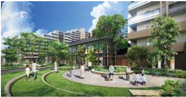
「みんなの広場」完成予想図