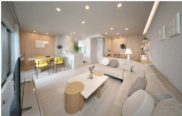
リビングダイニング②