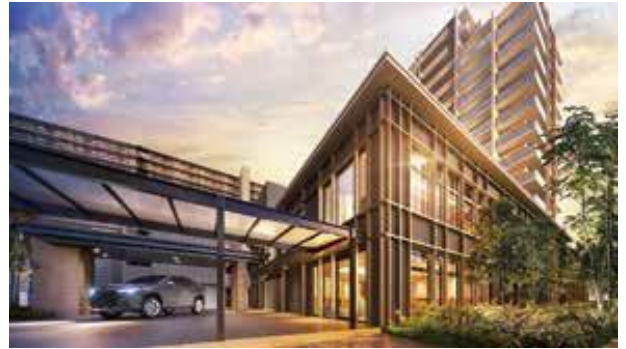
「コーチエントランス」完成予想図