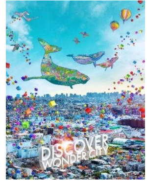
本物件のコンセプトビジュアル

「DISCOVER WONDER CITY」というプロジェクトコンセプトのもと、ワクワクと心躍る「ワンダーなモノ・コト」にあふれるくらしとなるような空間設計としております。噴水を設置しファミリーが憩える「みんなの広場」や、グランピング・バーベキューといったアウトドアレジャーを楽しめる「ルーフトップガーデンワンドフル」、仲間とのパーティーを楽しめる「パーティサロンワンダー」など、6つのガーデン&8つのコモンスペースを創出し、571世帯の多様なくらしを支えています。