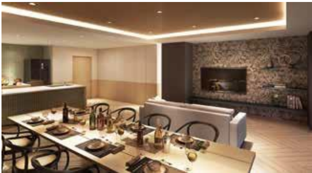
「パーティサロンワンダー」完成予想図