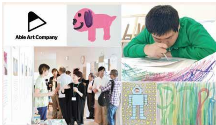
パラアートイメージ写真