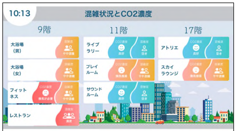
<長谷工オリジナルの健康サポートアプリ>