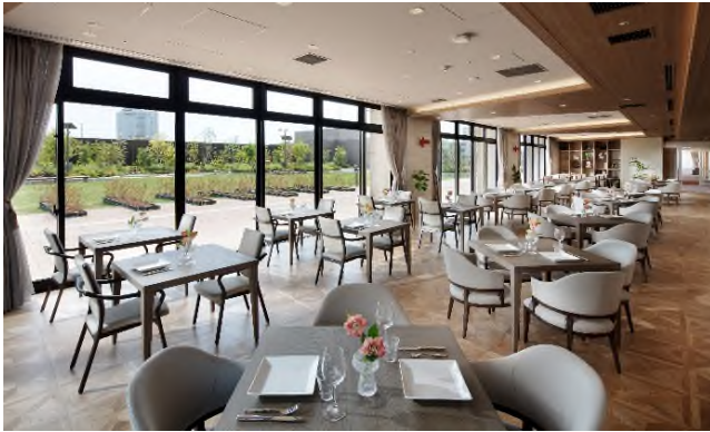
<レストラン・ラウンジ>

趣味・健康・知的好奇心の充足など様々なご要望にお応えするため、多彩な共用空間をご用意しており、日常の様々なシーンを館内で自由にお楽しみいただけます。