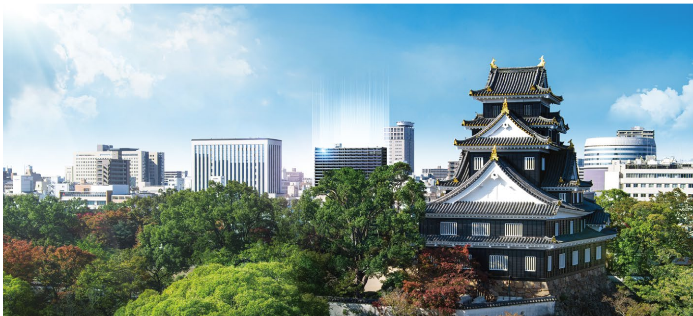
岡山城からの本計画外観