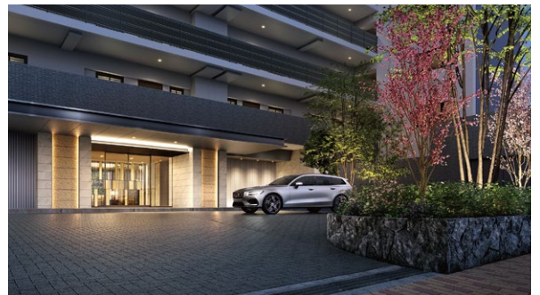
西側エントランスホール前の車寄せ