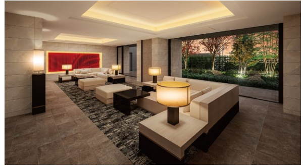
エントランスラウンジ