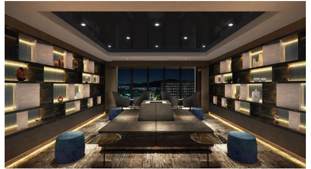
18階スカイビューラウンジ