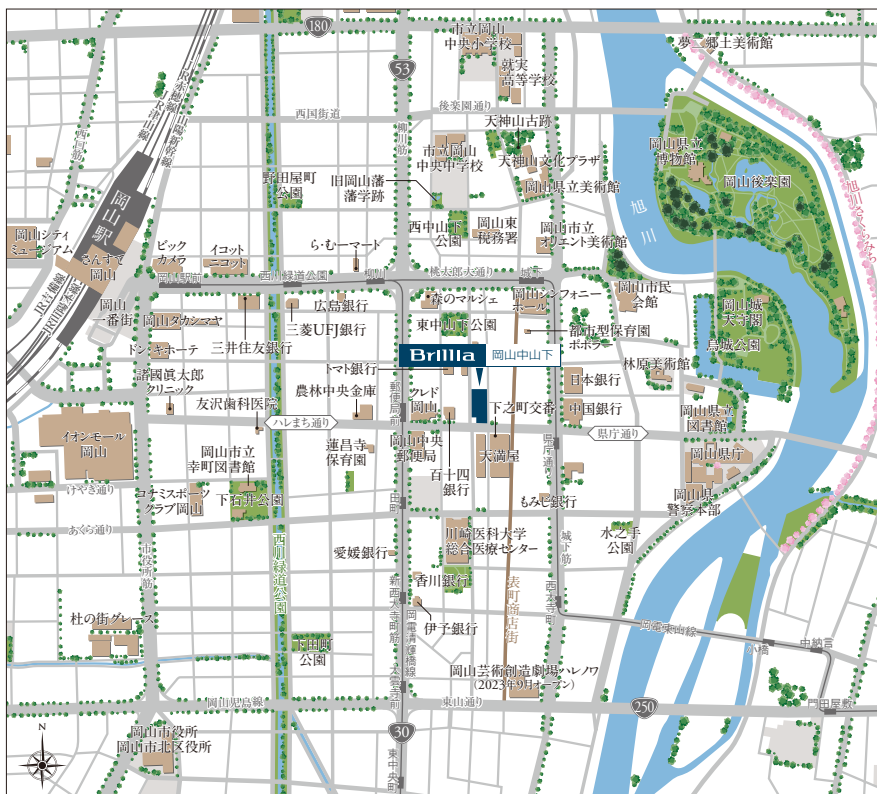
『Brillia岡山中山下』建設地位置図