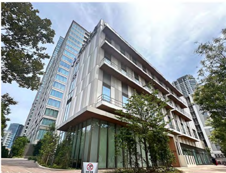
身近な医療施設はホームドクターとして安心。ものづくりの街の文化を継承する町工場も足元。

①住宅・病院・工場といった既存都市機能の維持・更新を図るとともに、街区再編を行う都市環境計画。