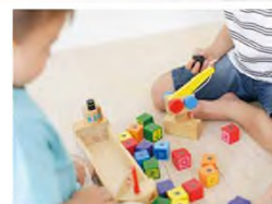
子育てファミリーをサポートする子育て支援施設を設置。