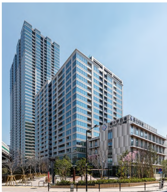
「SHIROKANE The SKY (白金ザ・スカイ)」

※ 参加組合員として、東京建物株式会社、株式会社長谷工不動産、住友不動産株式会社、野村不動産株式会社、三井不動産レジデンシャル株式会社が参画