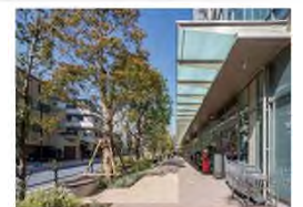
毎日の暮らしに便利さと賑わいをもたらす商業施設も誘致。