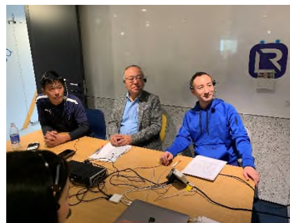
【LIVE RUN 実況中継の様子】