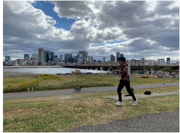
【LIVE RUN 当日参加者の様子】