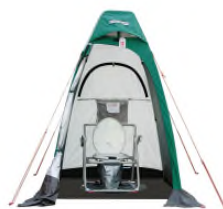
※非常用マンホールトイレ 参考写真

万一の災害発生時に備え、マンホールの蓋を外して設置するトイレ、炊き出しに利用できるかまどスツールを設置しています。