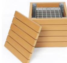
※かまどスツール 参考イラスト

※1 豊橋市でZEH-M Orientedの認定を受ける初の分譲マンションとなります。