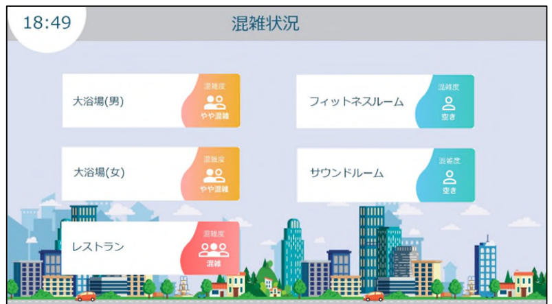
<共用施設の混雑度を確認するイメージ画像>