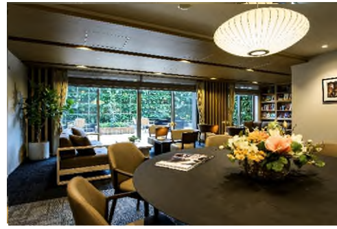
<ライブラリーラウンジ>