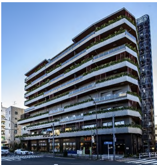
<バイオフィリックデザインの外観>

また本施設は、長谷工エアネシスが具現化したIoTを活用したサービスを導入しています。共用施設の混雑具合をお部屋から確認できる機能のほか、顔認証を活用した自動ドアの開錠や宅配通知、ご家族の入退館手続きの簡素化などのサービスを提供いたします。更に、長谷工オリジナルの運動習慣・食習慣を改善する健康サポートサービスや、ワイン講座、アート&デザインなど多彩な体験プログラムにより、「健やか」で「楽しい」住環境をご提供いたします。