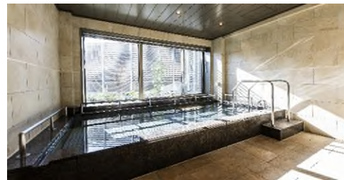
<人工温泉の大浴場>