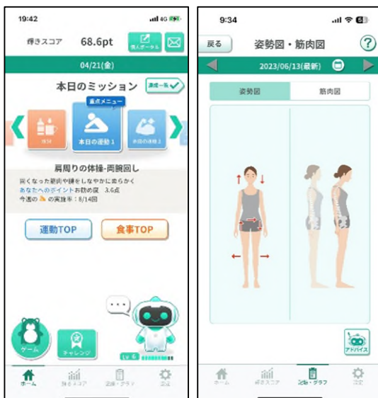
<長谷工オリジナルの健康サポートアプリ>

AI を活用した長谷工独自のスマートフォンアプリにより食生活と運動習慣から健康増進をサポートします。また、空間の密集度や人の出入りをカメラで感知し共用施設の混雑度を計測する機能も備えており、お住まいの方はご自分のスマートフォンやタブレットからも確認することができます。