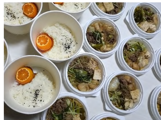
【寄付した野菜を使った料理】※こども食堂提供