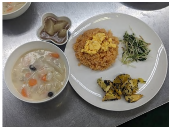
【寄付した野菜を使った料理】